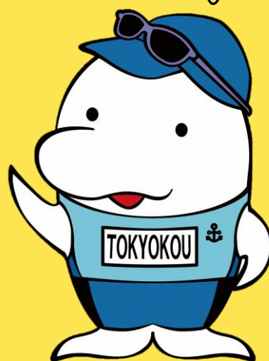
健保イメージキャラクター 「サンテくん」

組合員のみなさまは、色々な 補助やサービスを受けられます！ 家族みんなで今すぐ LINEで友だち追加しましょう！